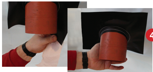
Schritt 4 - Schutzfolie unten abziehen und fest an die Dampfsperre andrücken