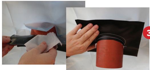
Schritt 3 - Schutzfolie oben abziehen und fest an die Dampfsperre andrücken