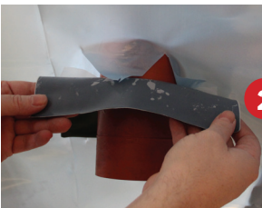
Schritt 2 - über das Rohr ziehen mit geteilter Schutzfolie waagrecht